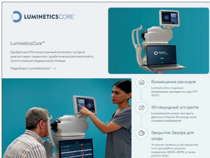
Рис. 1. Система искусственного интеллекта IDx-DR, разработанная для диагностики диабетической ретинопатии