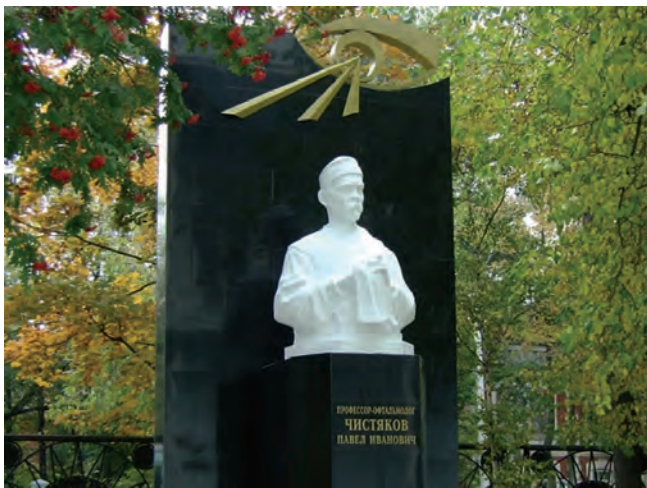
Рис. 2. Памятник Павлу Ивановичу Чистякову