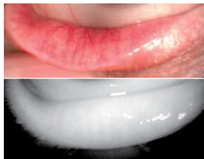
Рис. 3. Стадия 2. 51–75%