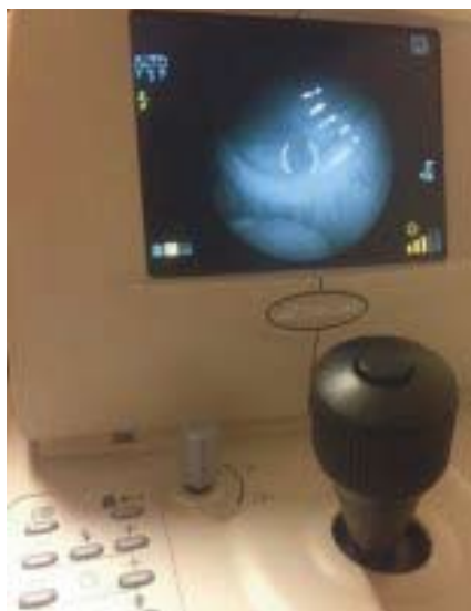
Рис. 1. Мейбоскопия

тической камерой в режиме наведения (в инфракрасном свете) (рис. 1). На мониторе фундус-камеры появляется черно-белое изображение мейбомиевых желез. При необходимости полученное изображение — ацинусы мейбомиевых желез в виде участков гиполюминисценции и промежутки между железами или «выпавшие» железы и протоки желез в виде участков гиперлюминисценции — можно документировать любым устройством, оснащенным видеокамерой, включая телефон.